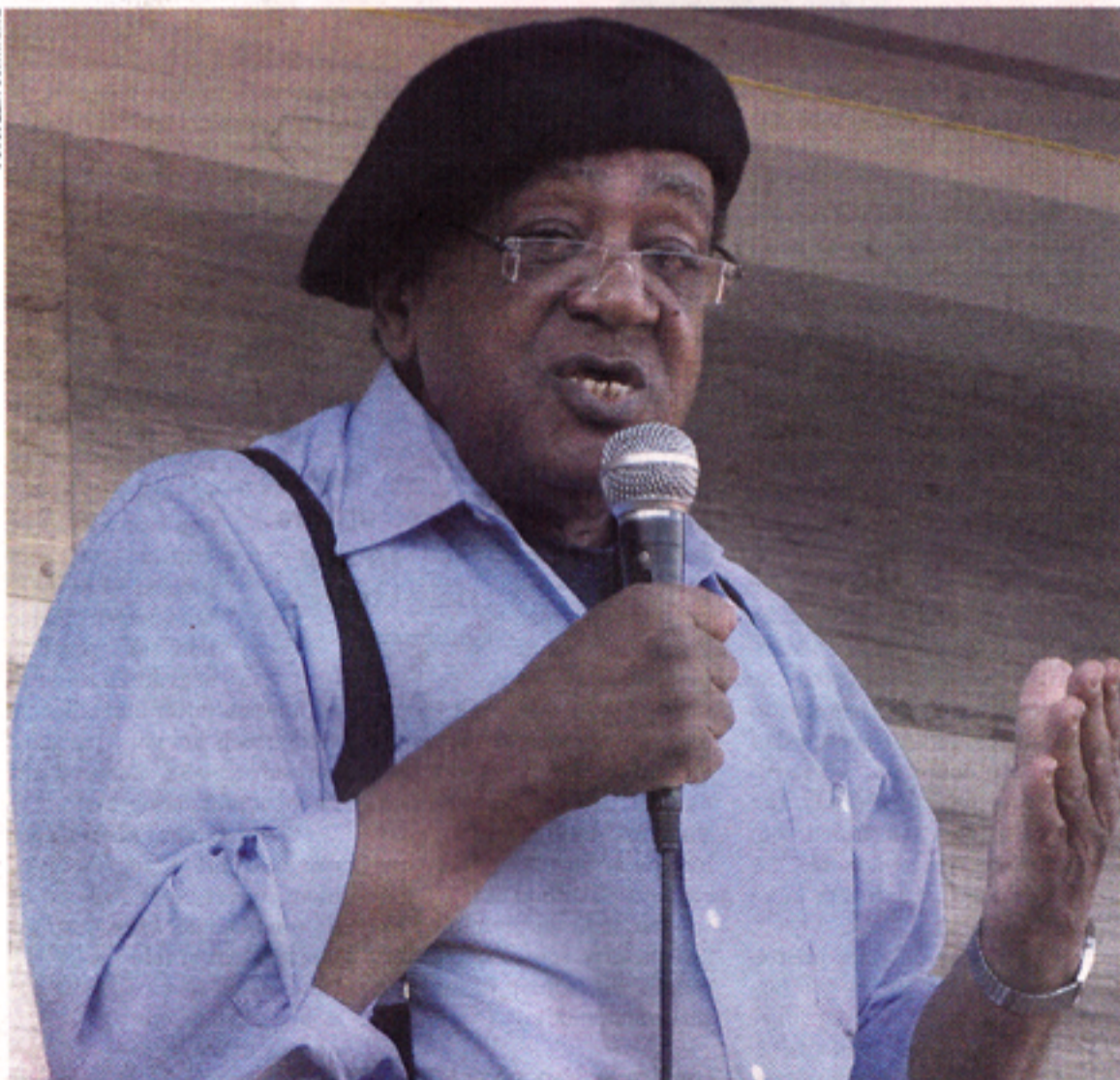
Bobby Seale var på 60-talet en av grundarna till de legendariska Svarta Pantrarna, en organisation som stred för att förbättra svartas ekonomiska och sociala situation. På första maj höll han ett inspirerat tal i Biskopsgården.